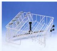
O 882 overkurv Til 27 glas eller krus Ø65 mm