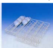
E 809 indsats til kopper Placeres i U 881 Til 23 kopper Ø90 mm