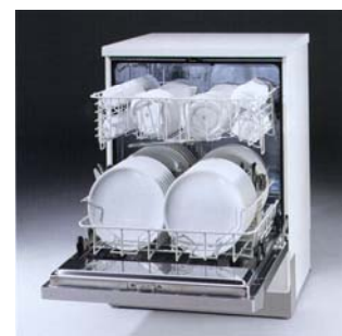
Indretning med 2 kurve