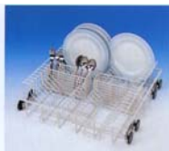
U 880 underkurv Til diverse indsats. Her 2 stk. E 216 og 2 stk. E 165