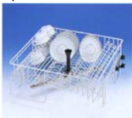
O 881 overkurv Til 20 kopper og 24 desserttallerkener

Indretningsmulighederne i opvaskemaskine G 7859 er mange og kan tilpasses med forskellige kurve alt efter opvaskebehov. Herunder ser du de mest anvendte kurve. Se hele udvalget på løvsblad med kurve eller på vor hjemmeside.