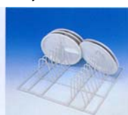
E 888 Hel indsats Til 16 tallerkener eller fade. Afstand mellem holdere 33 mm. Holdernes højde 170 mm.