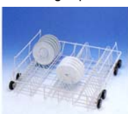
U 881 underkurv Til 54 underkopper eller asietter